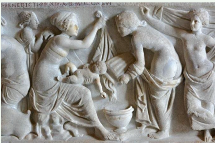
Bas-relief romain antique «La Naissance d'un enfant»