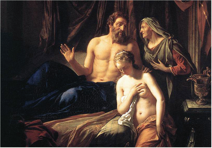
Sarah amène Agar à Abraham. Adriaen van der Werff (1659–1722)

je te prie, vers ma servante; peut-être aurai-je par elle des enfants. Abram écouta la voix de Sarai». Il est clair qu'une telle sélection de mères porteuses était exclusivement subjective, non scientifique, basée sur l'attractivité externe et les données de santé connues à l'époque. Jusqu'à présent, cette pratique reproductive, où la mère porteuse est simultanément donneuse d'ovocytes – cellules reproductrices femelles impliquées dans la reproduction (c'est-à-dire, transfère son matériel génétique à l'enfant) et, après la gestation, le donne à des tiers, reste la méthode officielle dans certains États des États-Unis pour résoudre les problèmes de reproduction. Ce qui est commun à la maternité de substitution traditionnelle, c'est que la parenté biologique partielle, en termes juridiques et psychologiques, s'est révélée secondaire ou insignifiante par rapport à la parenté sociale.